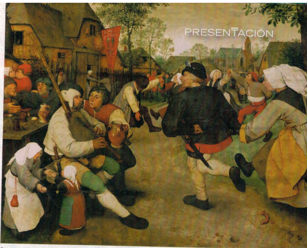
En portada, la Torre de Babel (detalle), 1563, óleo sobre tabla, 114 x 154 cm. Sobre estas líneas, La danza campesina , 1568, óleo sobre tabla de roble, 111 x 164 cm. Las dos obras, por Pieter Bruegel el Viejo, Viena, Museo de Historia del Arte.

Esta revista ha recibido una ayuda a la edición del Minis- terio de Cultura y Deporte-Dirección General del Libro, del Cómic y de la Lectura, y del Plan de Fomento de la Lectura 2021-2024.