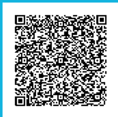
Centro Sociocultural Cánovas del Castillo