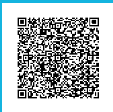
Programa de todo el Distrito