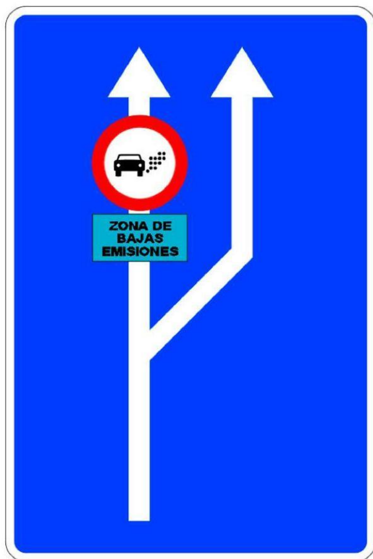
Señal S-62B ZBE: