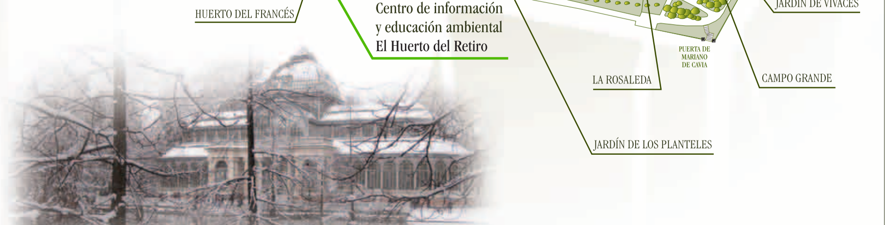
Centro de información y educación ambiental El Huerto del Retiro