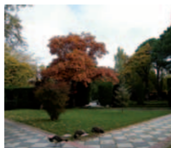
Jardines de Cecilio Rodríguez

En este tramo de la ruta destacan, por su exotismo, el abeto de Masjoan y el arce plateado, además del empleo del ciprés de Monterrey formando macizos con los que se refuerza el carácter arquitectónico del jardín clásico.