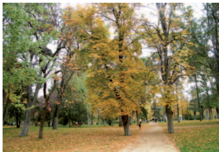
El Campo Grande