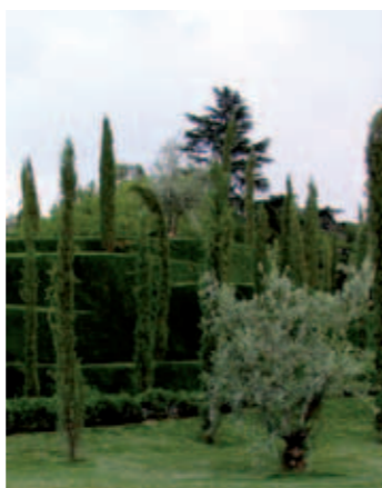
Bosque del Recuerdo

Del siguiente tramo, que se inicia en el jardín conmemorativo del Bosque del Recuerdo, conviene destacar el plantío de más de trescientos almendros que componen el Huerto del Francés, ya que nos remite a la composición arbórea del Retiro que prevaleció entre su fundación y su conversión en parque público en 1868. Hasta entonces, los jardines del Buen Retiro siempre incluyeron árboles ornamentales y frutales.