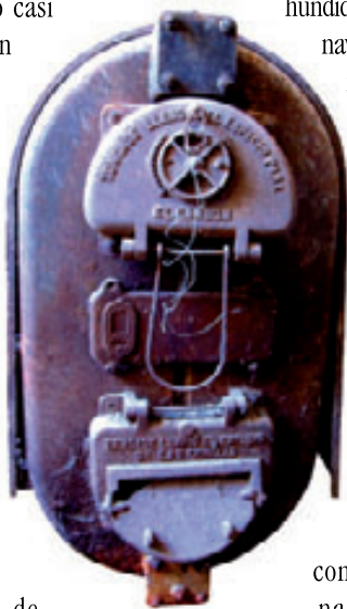
Detalle de la caldera original de la Estufa nº 8

y leña -calderas- situadas en cuartos hundidos en los extremos de las naves. El calor se distribuía mediante una canalización de tuberías que transportaba el agua caliente. En los invernaderos antiguos se utiliza como cubierta el cristal, por permitir un mejor rendimiento lumínico y térmico.