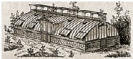
Grabado de invernadero a dos aguas con cubierta curvilínea, estilo del cuerpo central de la Estufa nº 1

La denominación “estufas” hace alusión al sistema de calefacción utilizado inicialmente por ingleses y franceses, pioneros en la construcción de invernaderos. Los ingleses llamaban stove -estufa- a los invernaderos, por calentarse mediante estufas de carbón