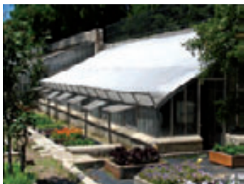
Invernaderos más antiguos del vivero, posiblemente de la segunda mitad del s. XIX