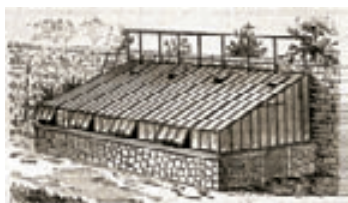
Grabado del modelo de los invernaderos adosados al muro norte del vivero de Estufas

A partir del s. XIX, las estufas comenzaron a calentarse con el sistema denominado termosifón. Actualmente se calientan por un moderno sistema de calderas de gas.