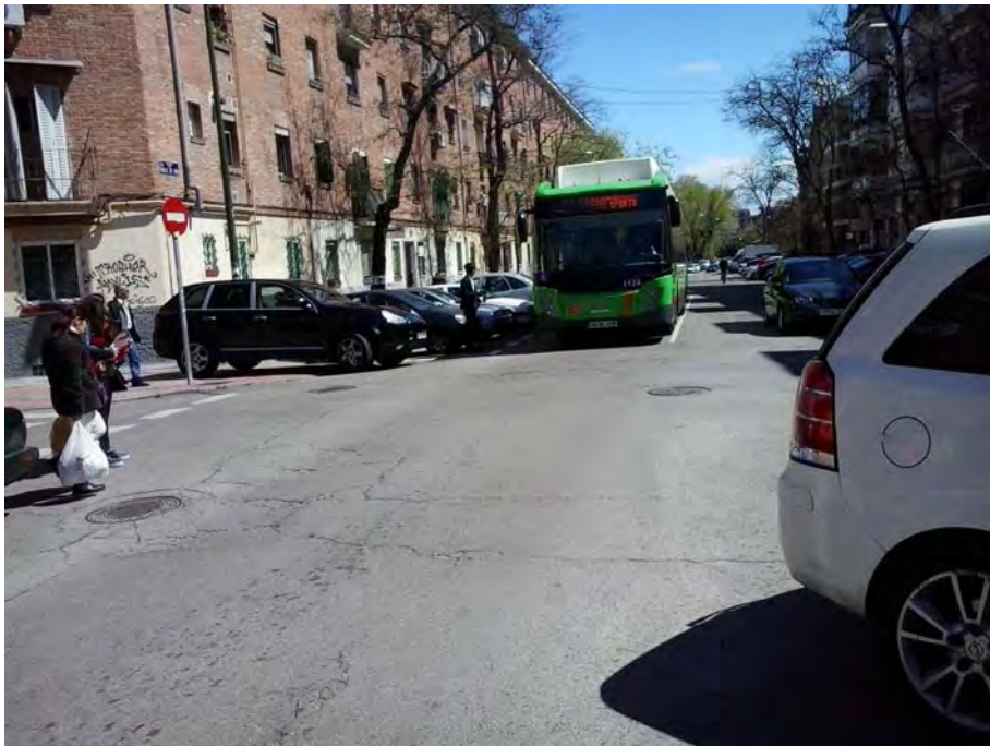
Cruce con C/ Doctor Espina.