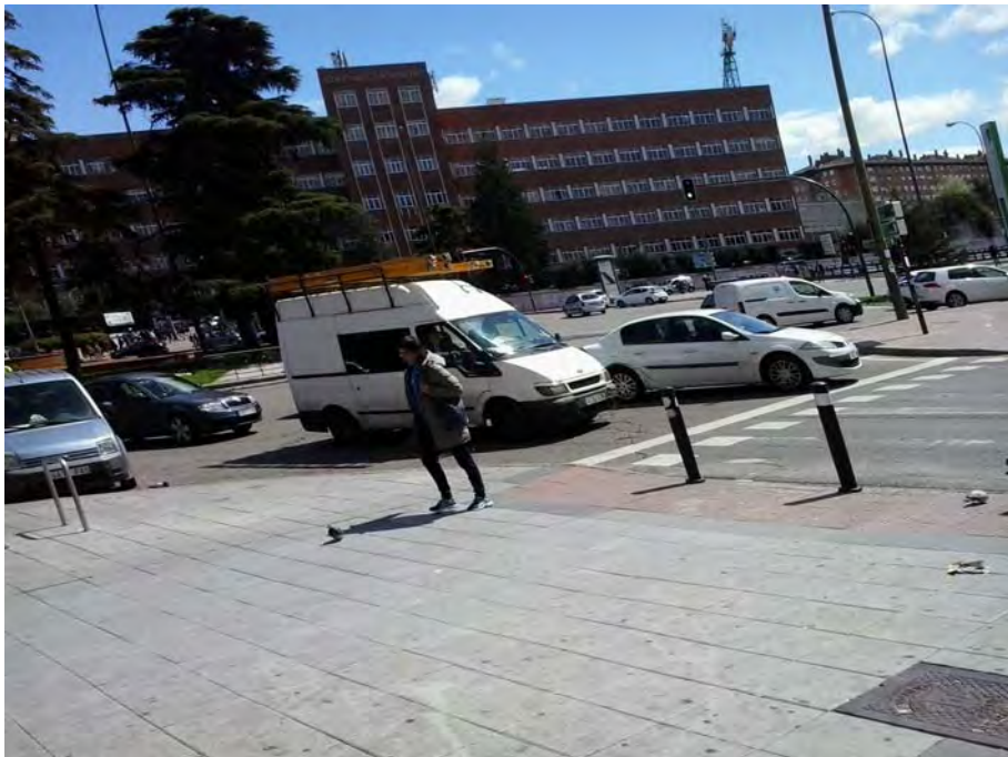
Conexión con Glorieta Fernández Ladreda.