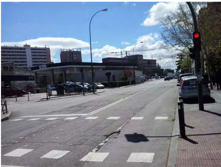
Conexión con la Glorieta de Fernández Ladreda.