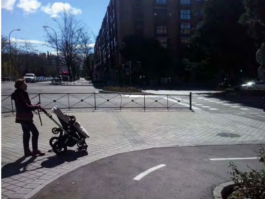
Cruce con Pseo. Doctor Vallejo Nájera, rejilla de ventilación.