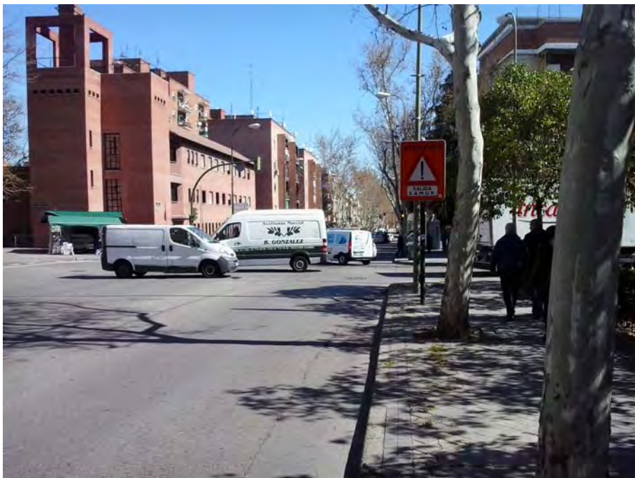
Cruce con Avda. Nuestra Señora de Fátima.