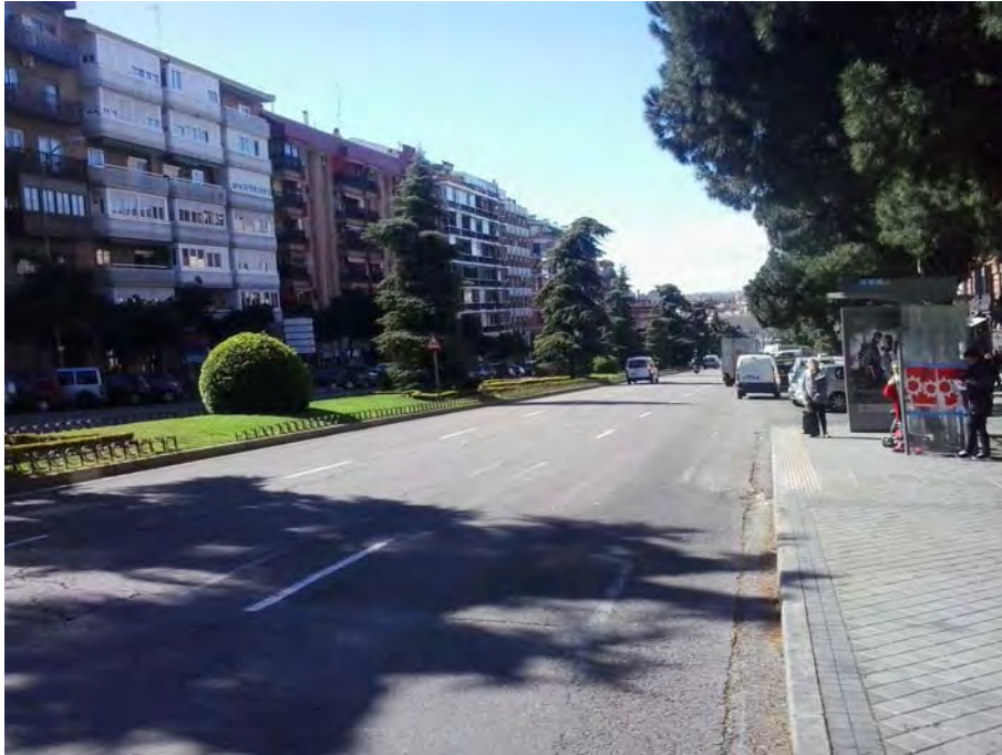
Frente Hotel Puerta de Toledo.