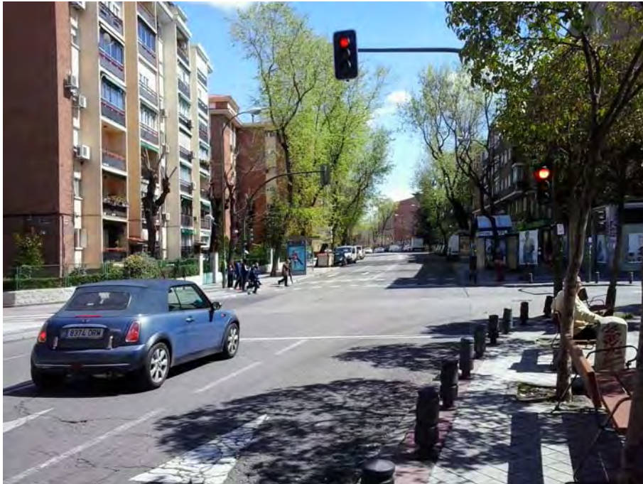
Cruce con el Camino Viejo de Leganés