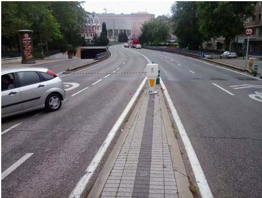
Paso superior de Pza España.