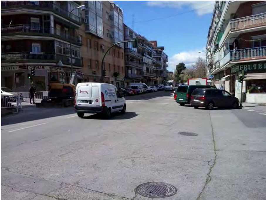
Cruce con calle Mercedes Domínguez