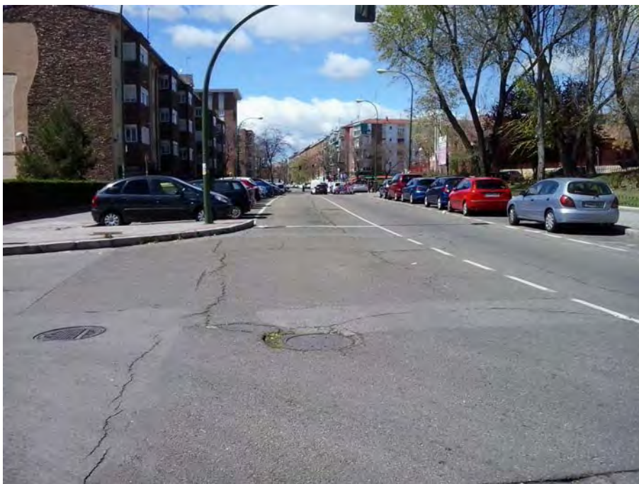
Tramo frente a los colegios