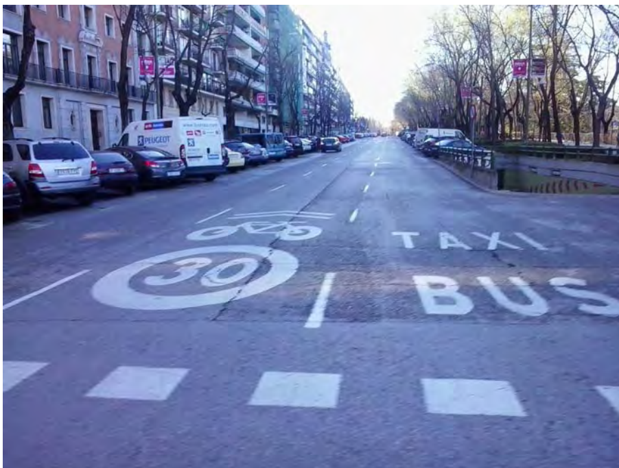
Después del cruce del Paseo de Camoens