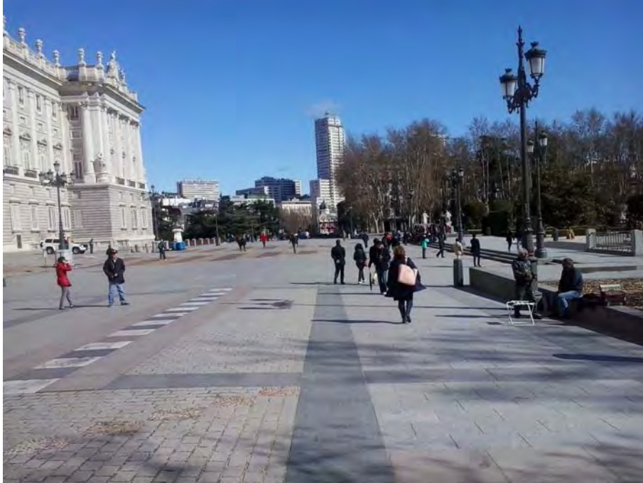
Pza. de Oriente.