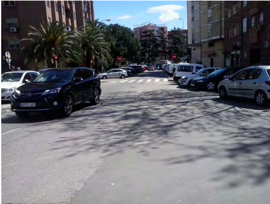
Conexión con la Glorieta de Fernández Ladreda.