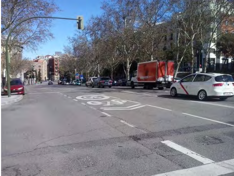
Conexión con Glota. de San Francisco.