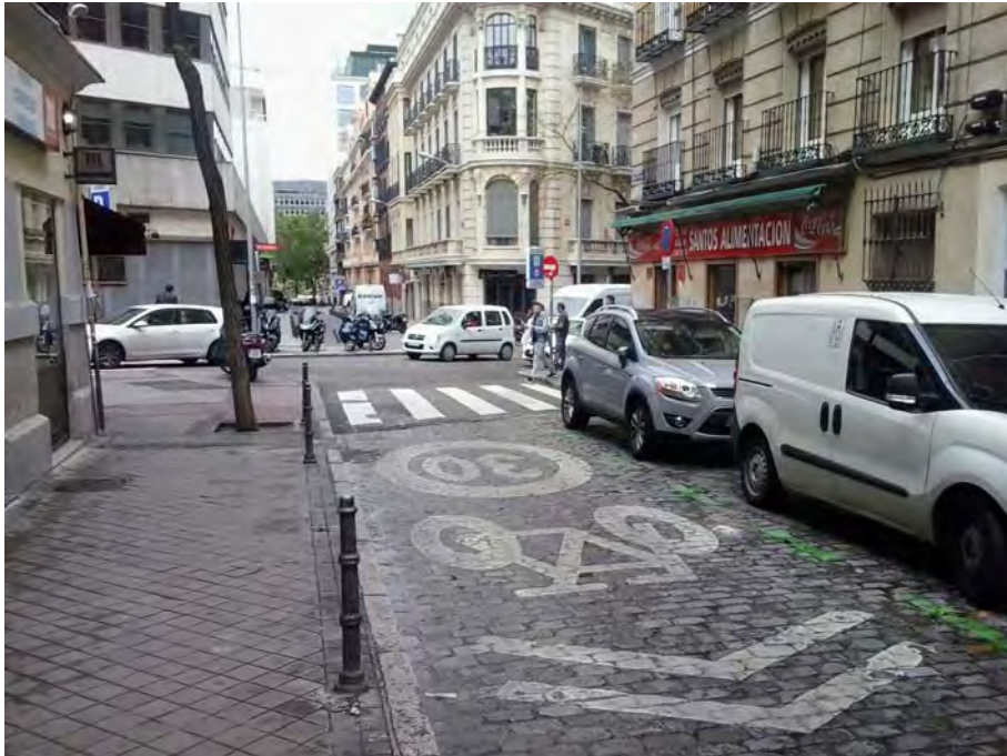
Conexión con C/ Ventura Rodríguez.