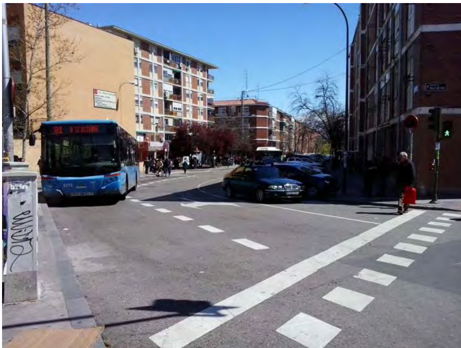
Conexión con Glorieta Valle de Oro.