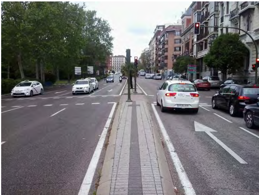
Cruce C/ Ventura Rodríguez