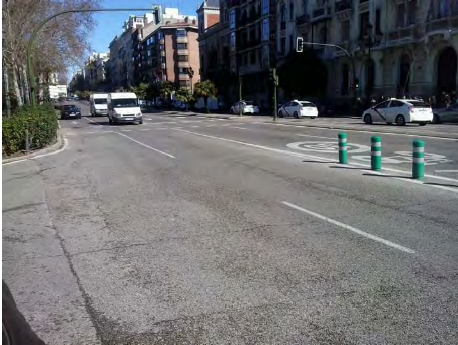
Cruce con la calle Irún