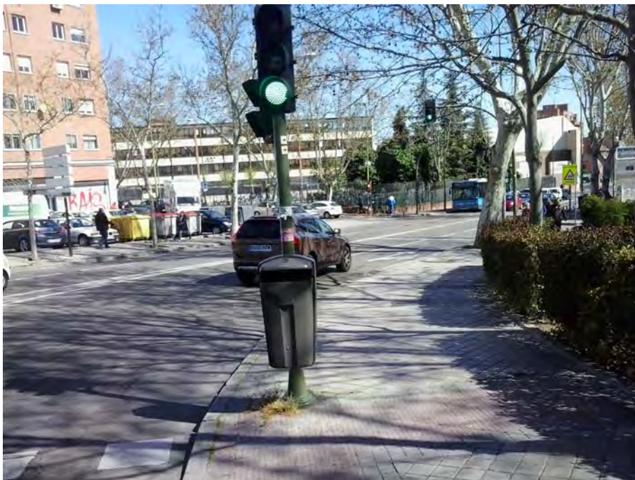
Conexión con Avenida de los Poblados