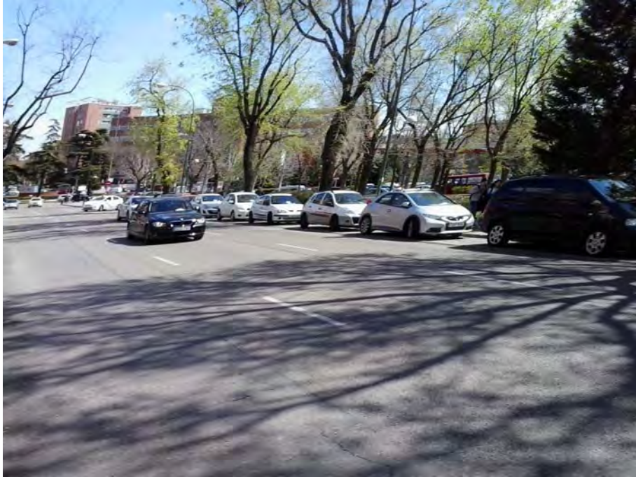
Conexión Vía Lusitana.