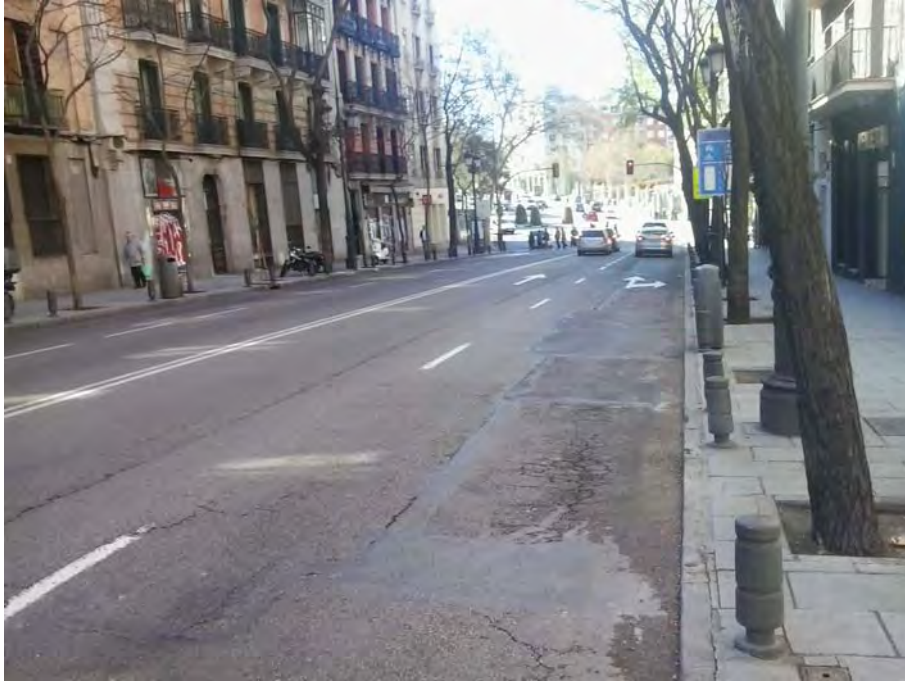
Conexión con Glota. de San Francisco