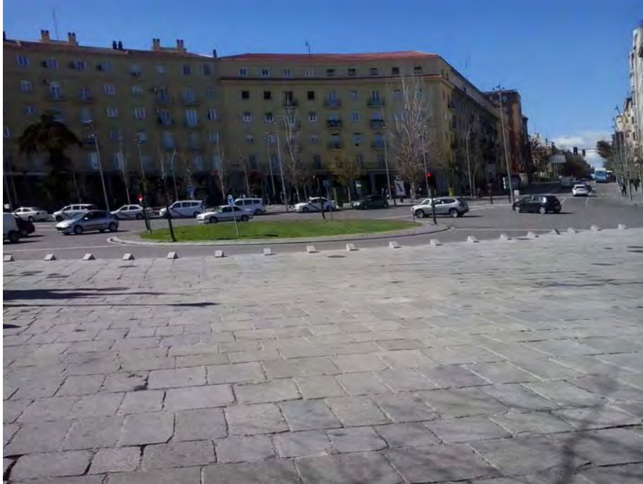
C/ General Ricardos al fondo