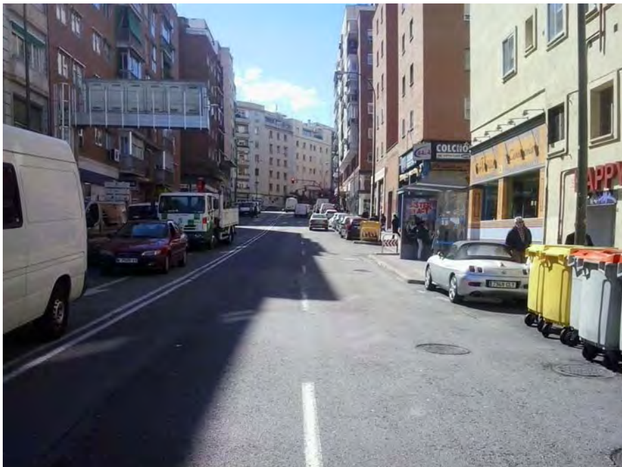
Inicio de la calle.