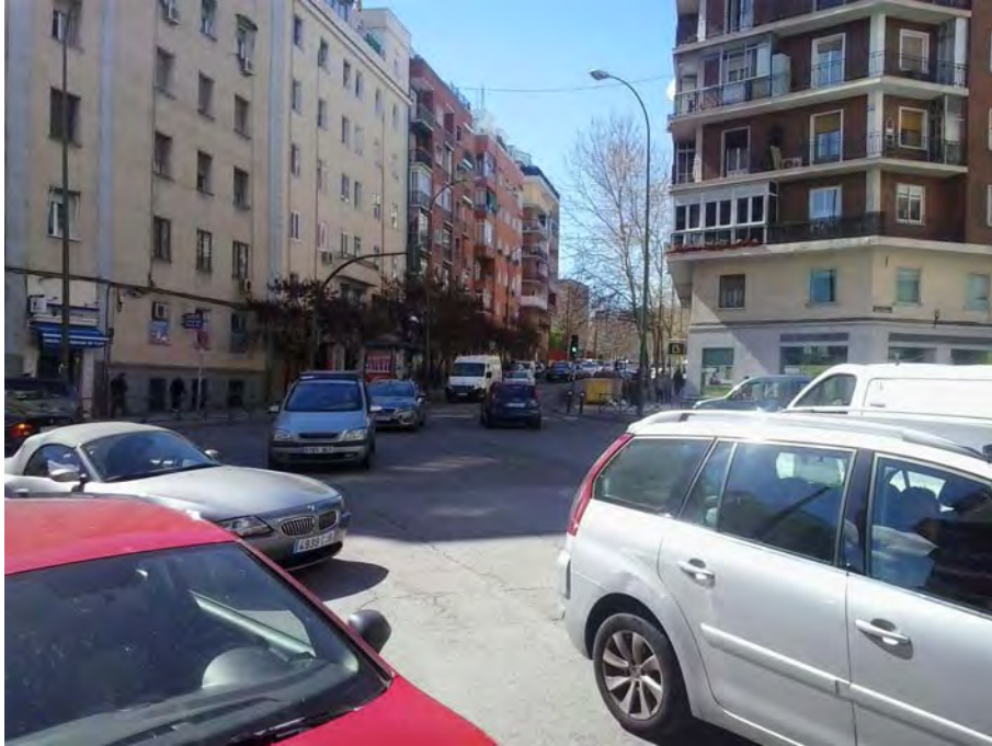
Cruce con C/ Fuenlabrada.