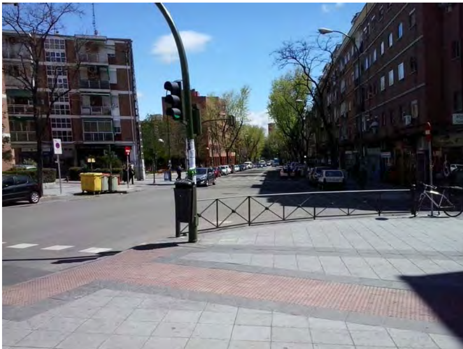
Cruce Calles Doctor Espina y Luis Gómez.