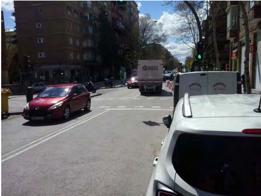
Cruce con C/ Alejandro Sánchez y C/ Guadalete.