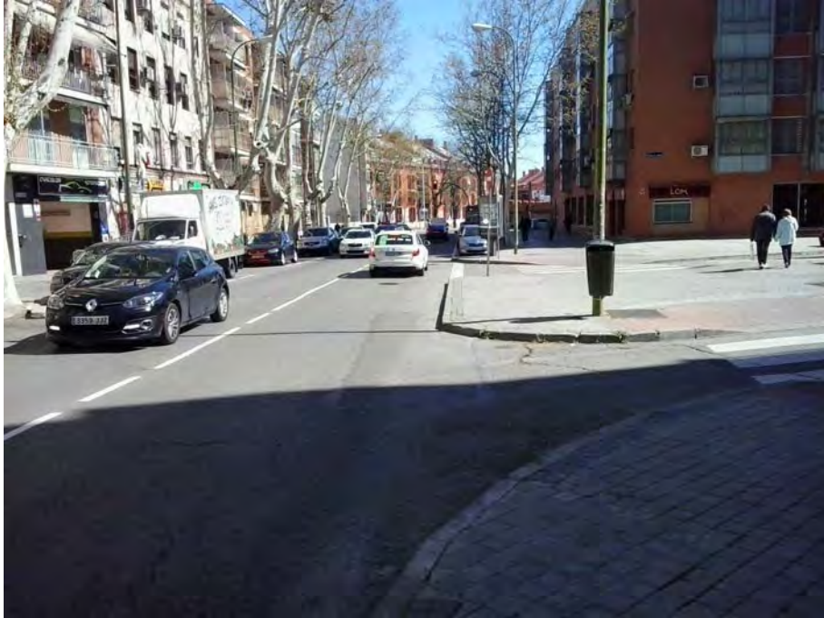
Cruce calle José Cárdenas.