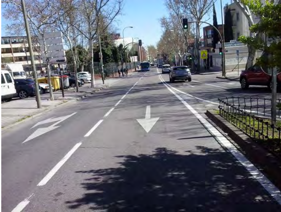
Conexión con Avenida de los Poblados.