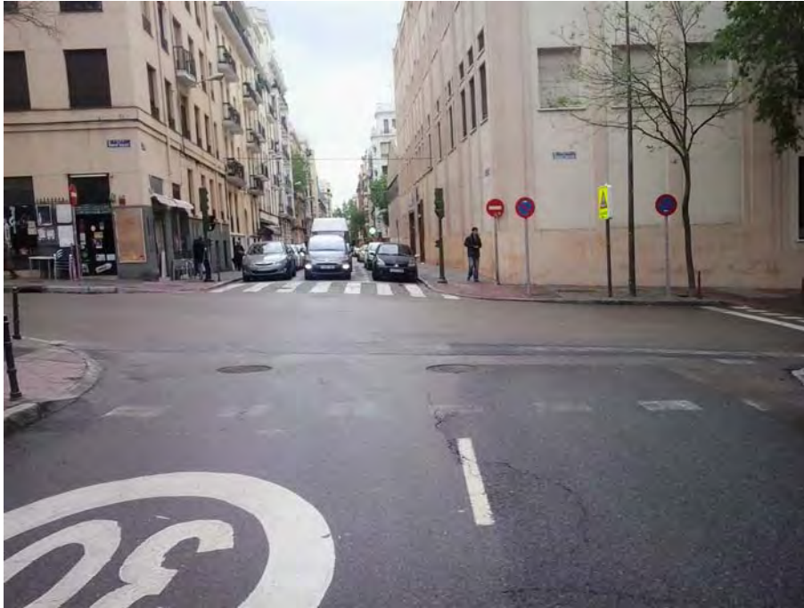
Cruce con C/ Romero Robledo, cambio de sección