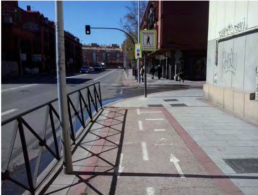
Conexión con calle General Ricardos.