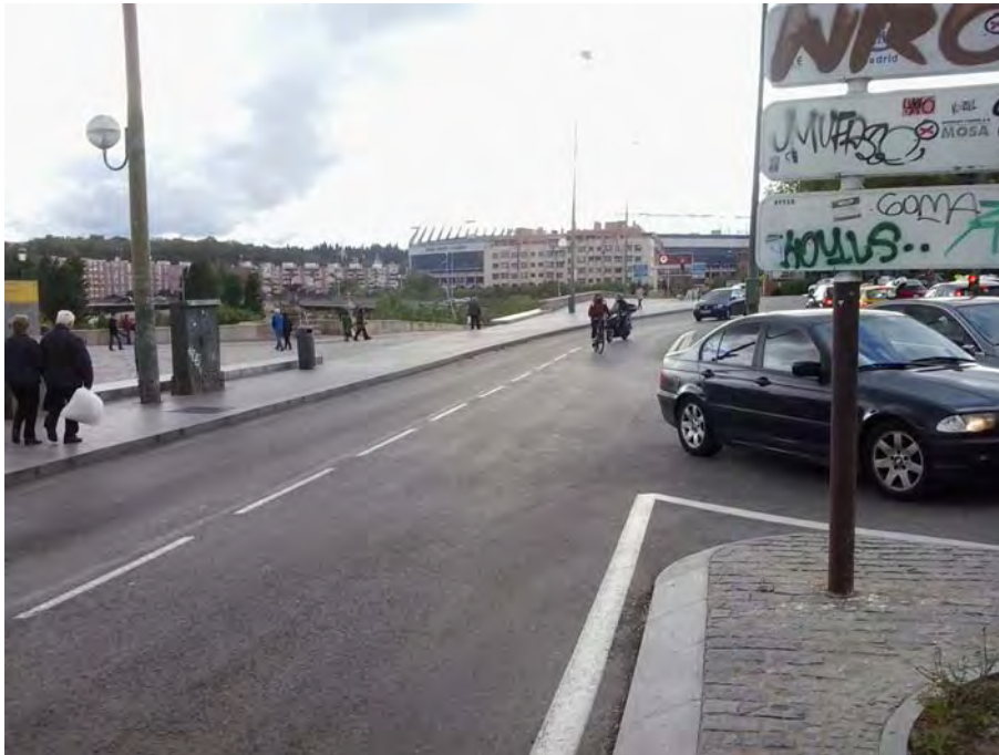
Conexión con Puente de Toledo