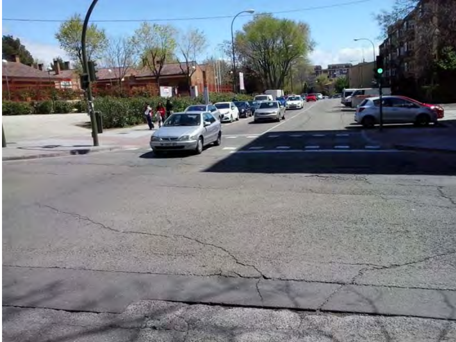
Cruce con el Camino Viejo de Leganés.