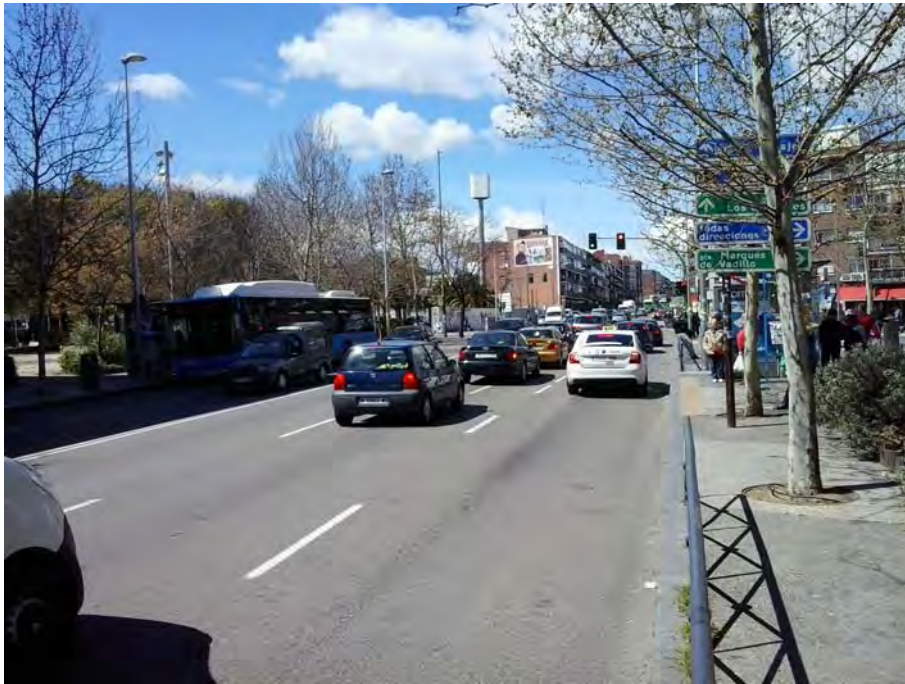
Conexión con C/ General Ricardos.