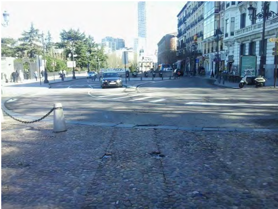
Conexión con Pza. de Oriente.