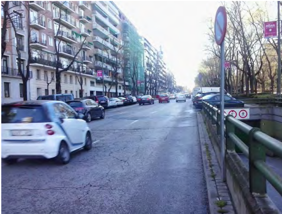
Entrada de Aparcamiento de residente.