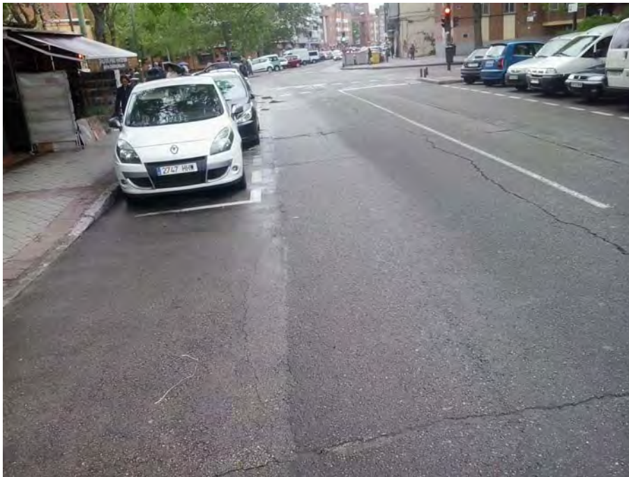
Conexión con C/ de la Vía, cruce con la C/ Portalegre