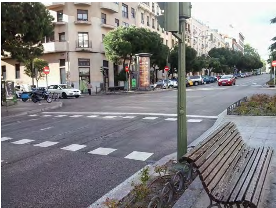
Cruce C/ Santa Casilda