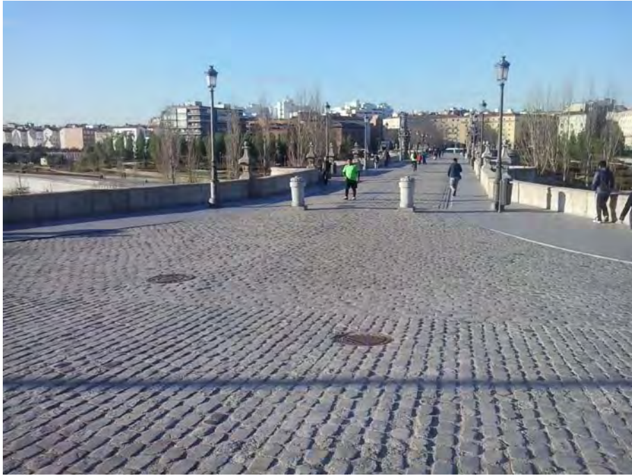
PUENTE DE TOLEDO.