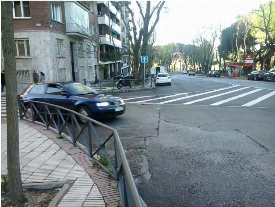
Cruce con la calle Ferraz.