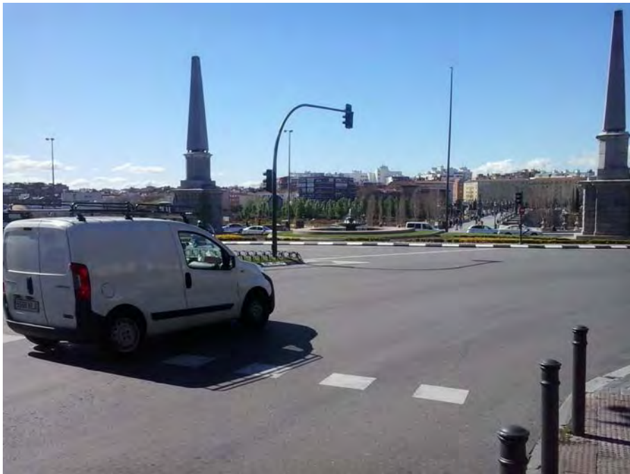
Conexión con Glorieta. de las Pirámides.