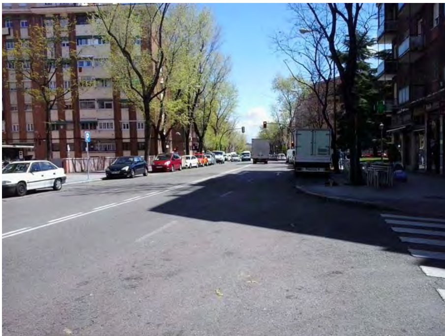
Zona San Vicente de Paul y cruces calles Francisco de Icaza y Argüeso.