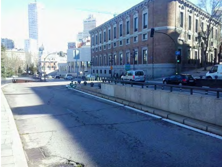
Cruce con C/ Torija, intercambio entre paso superior de Pza de España y paso inferior de Pza de Oriente.