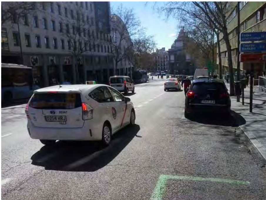
Conexión con Puerta de Toledo.