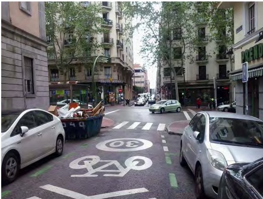
Cruce con C/ Marqués de Urquijo, cambio de sección.