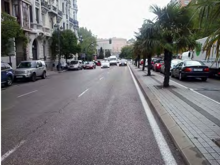
Conexión con C/ Bailén.