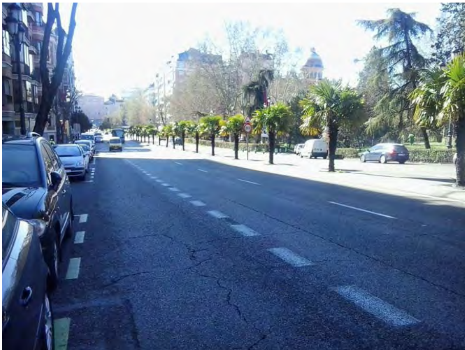
Frente Templo de Debod