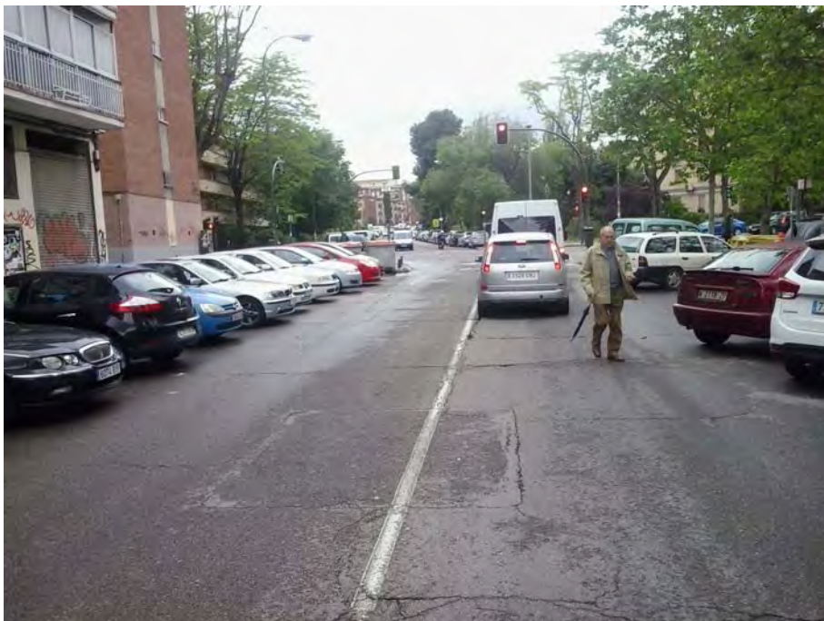
Conexión con C/ Valle de Oro, cruce con la C/ Portalegre.