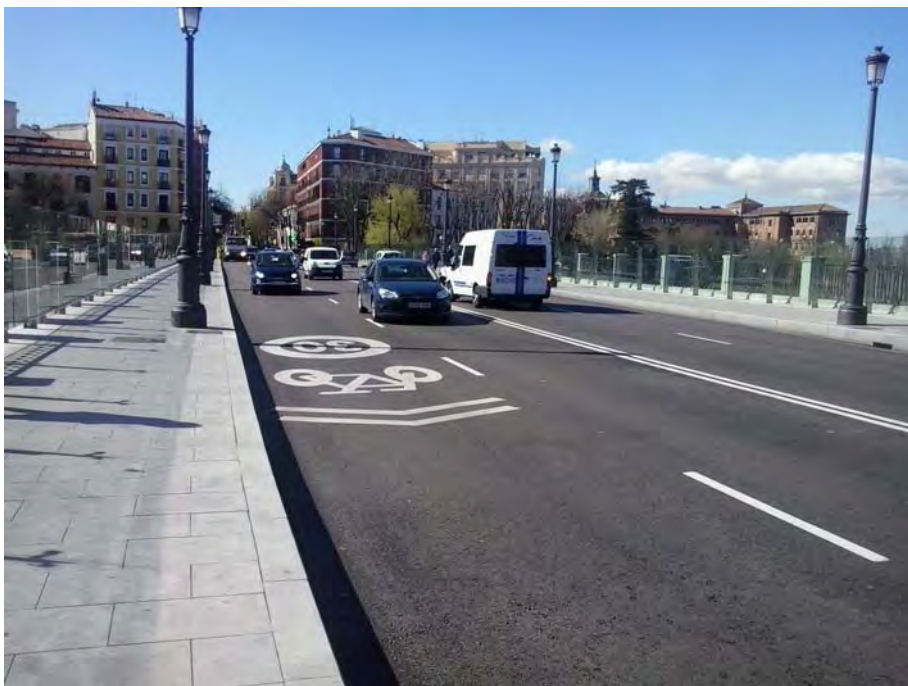
Viaducto sobre calle Segovia.