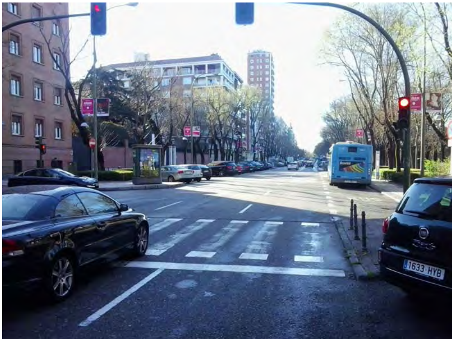
Actuales zonas reguladoras de Bus