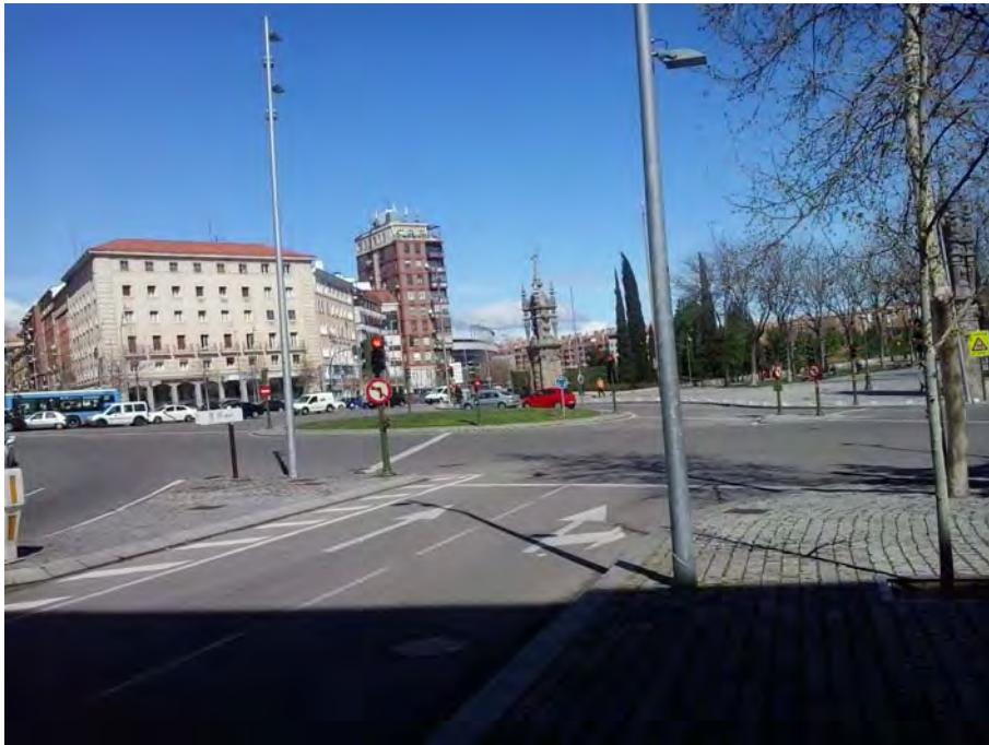
Conexión con Glota Marqués de Vadillo.