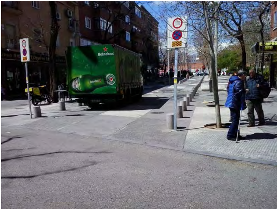
Tramo peatonal de conexión con C/ General Ricardos.