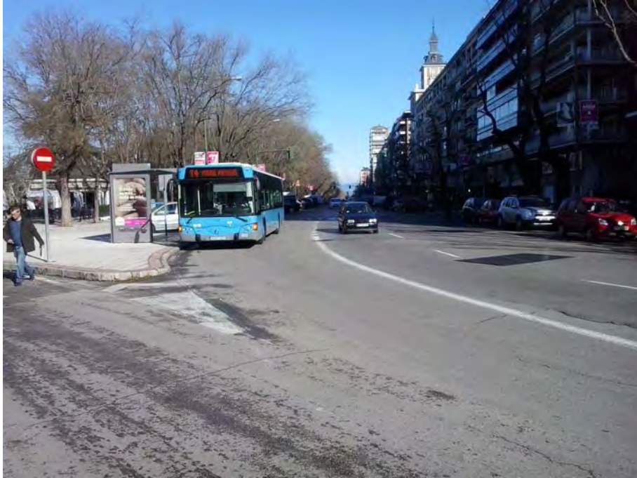
Cruce con la calle Prof Martín Almagro Basch