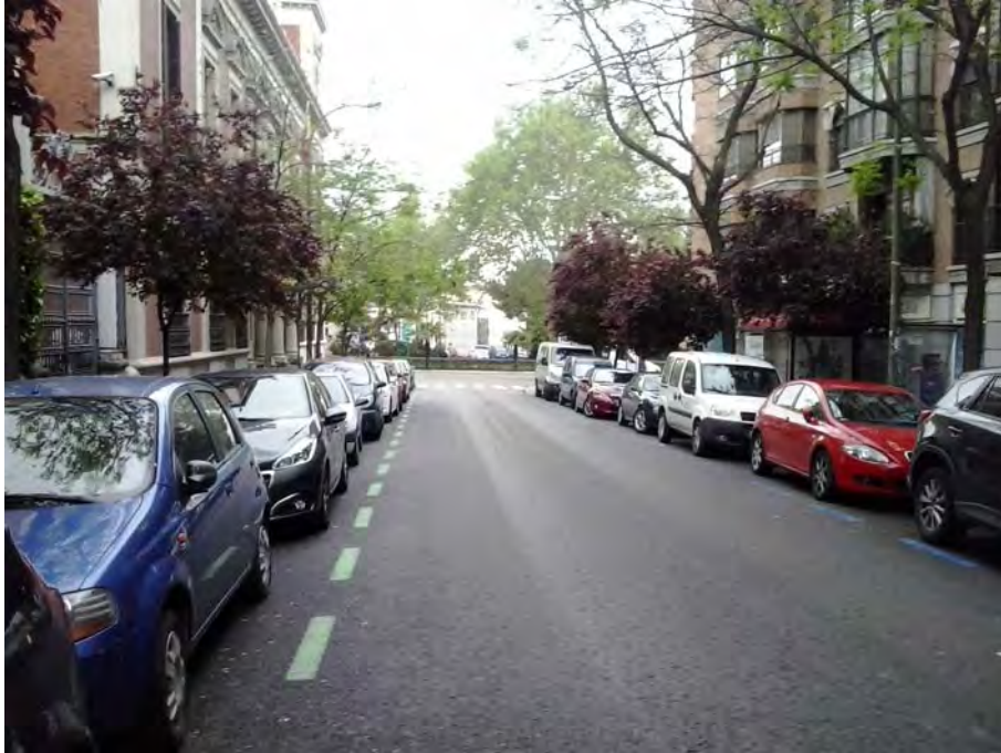
Conexión con C/ Ferraz