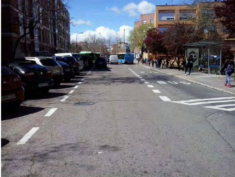
Cruce con C/ Río de Oro.