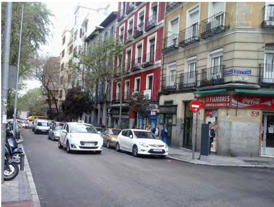
Conexión con c/ Martín de los Heros.