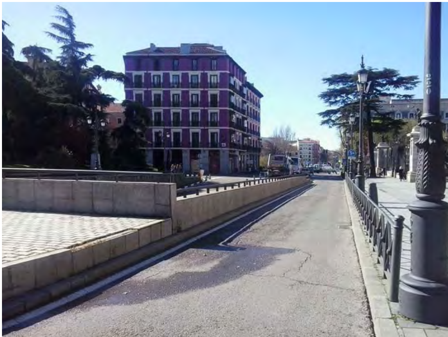
Frente a la Catedral de la Almudena.