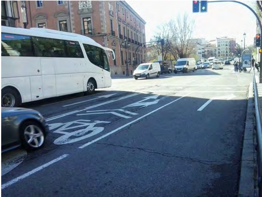
Cruce con C/ Mayor.