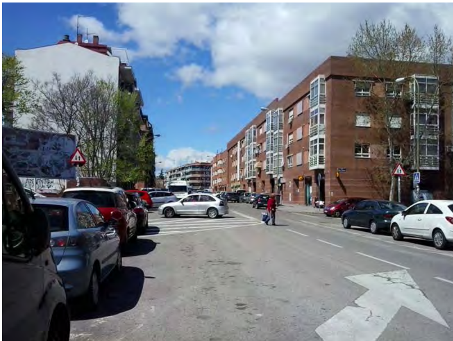
Cruce con calles Évora y Antonia Lancha, cambio de sección y sentidos.