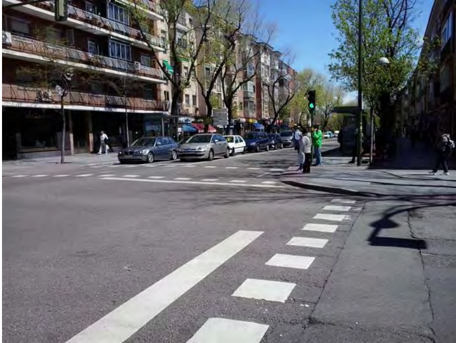
Cruce con la C/ Portalegre.