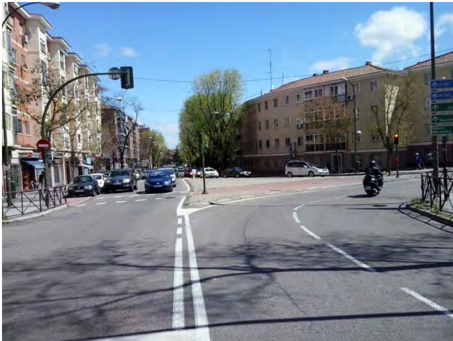
Cruce con las calles Mercedes Domingo, Abrantes y Braganza.