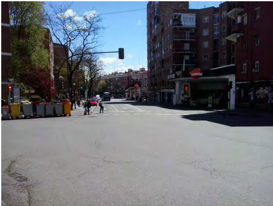
Conexión con Avda. de Oporto.