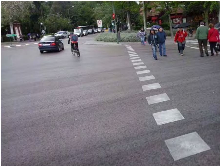
Cruce de salida de la M-30