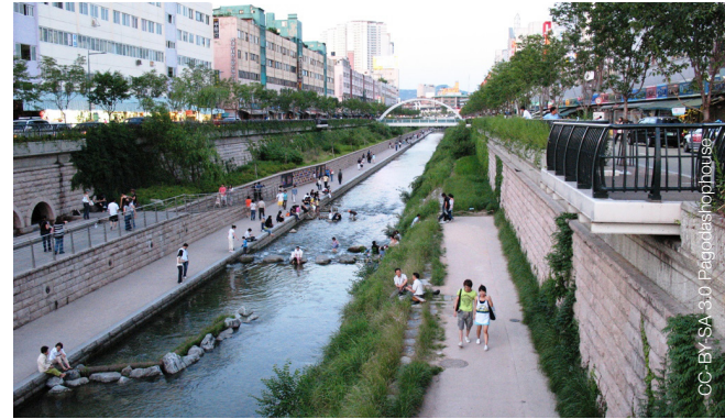
Seul, Corea del Sur

http://www.dreiseitl.com/index.php?id=47&lang=en