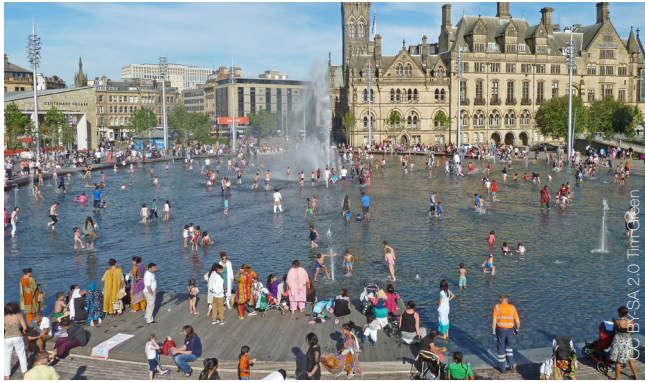
Bradford, Reino Unido