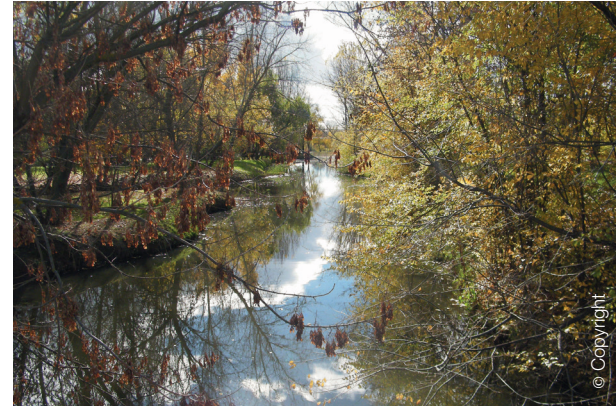
Usera y Villaverde, Madrid

En definitiva, se ha transformado una zona marginal de escombreras en una agradable zona de paseo en los márgenes de un arroyo.