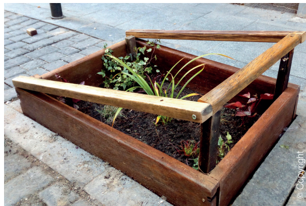
Barrio Malasaña, Madrid