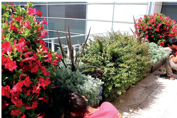
Junta de Distrito La Latina, Madrid