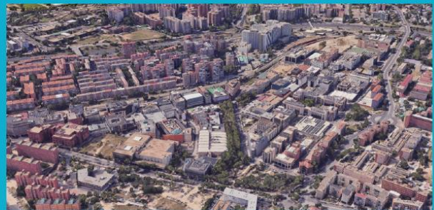
Ámbito de posible transformación. Polígono industrial de Fuencarral

Suelo destinado a usos mixtos (industrial, terciario y residencial).