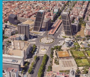
Ámbito de posible transformación. Plaza de Castilla

Uso dotacional para el transporte - intercambiador y vía pública