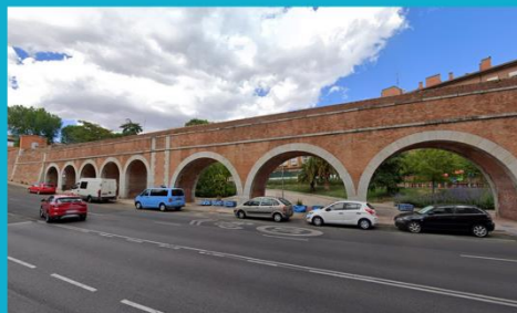
Arcos del Canal del Acueducto de Amanié, patrimonio urbano en el Barrio de Bellasvistas.

Suelo destinado a uso mayoritariamente residencial