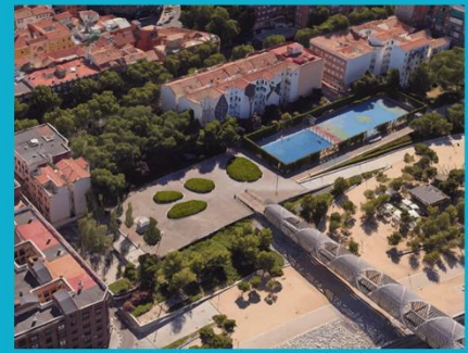
Ámbito de posible transformación. Entorno de Antonio López 27.

Suelo urbano sin edificar, uso dotacional, equipamiento público básico