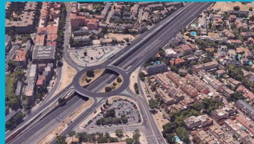
Entorno de la rotonda de la A-2 a su paso por el barrio de Palomas.

Suelo destinado a uso mayoritariamente residencial.