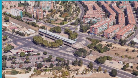
Ámbito de posible transformación. Entorno la Estación de Transporte de Aluche.

Uso dotacional para el transporte ferroviario, intercambiador, vía pública y zonas verdes