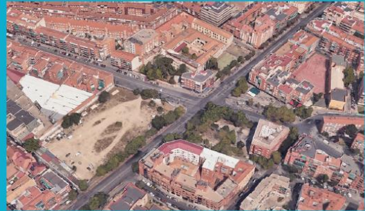
Ámbito de posible transformación. Entorno de la Estación Oporto.

Población de la sección censal del ámbito: 6.854