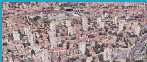
Ámbito de posible transformación. Colonia de la Esperanza

Área: 301.844,05 m 2 Población de la sección censal del ámbito: 7.912 Número aproximado de viviendas: 3.200 Suelo destinado a uso mayoritariamente residencial.