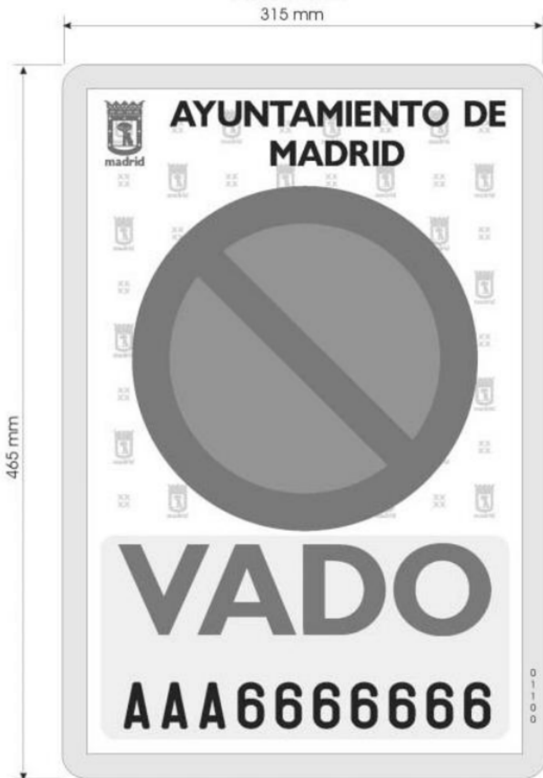
FIGURA 1 Detalle placa